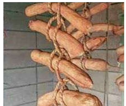
今はいぶり大根作りにはまっています。

事業で一番苦手なのは「経理」です。会社員時代も営業を担当していたので経理の知識や経験がなく、開業するまでも何度か心が折れそうになりました。経営者として数字の管理は最も大事なことです。今でも苦労しています（涙）。