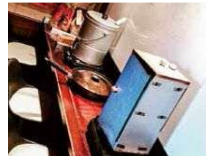
燻製の体験メニューもあります。

何かをやりたいと思っても、どうしていいかわからずあきらめてしまう人もいるかと思いますが、相談窓口はいろいろありますし、積極的に相談すれば何か道が開けると思います。 自分に負けるな！