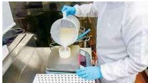
ひとつひとつ、型入れます。