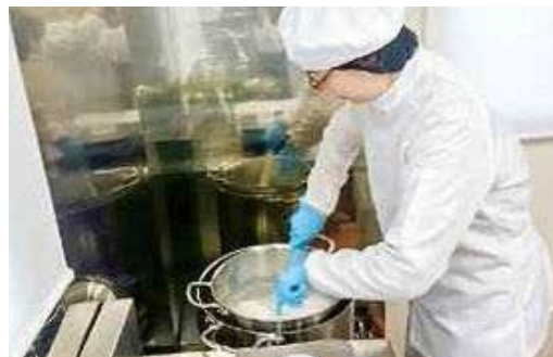
最初に石鹸素地を作り、保湿成分等を加えていきます。