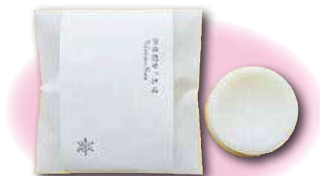
雪の泡せっけんの完成です!