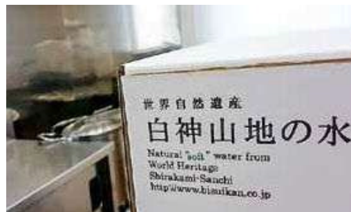
原料のオイルだけでなく水にもこだわりがあります。

あらゆる方々に今助けられているので、みなさんの支えや人とのつながりがないと無理、というのを実感しています。